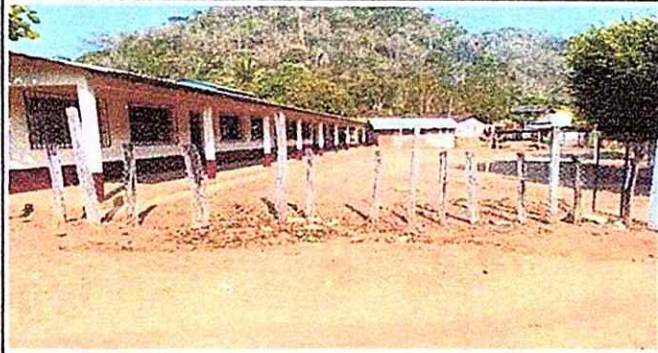
Foto1: Manetenimiento por deterioro de la malla